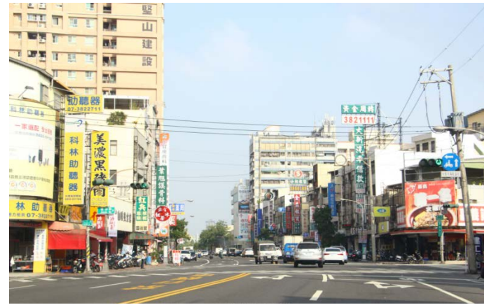
建工路東行往學校