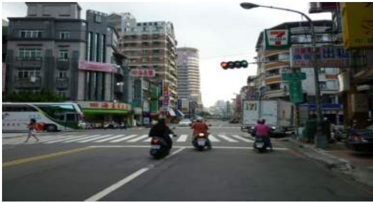
南北向-正忠路方向