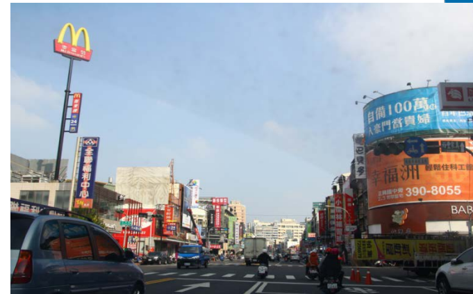
建工路東行往學校