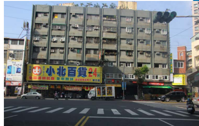
建元路右轉往學校