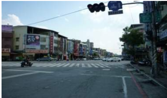
建工路西行待轉區