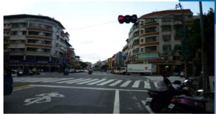
東西向-大豐二路方向