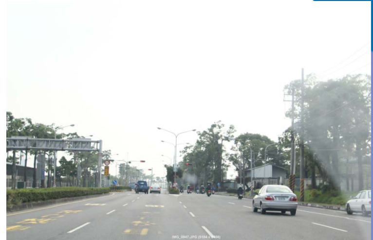
楠梓區南行往建工校區