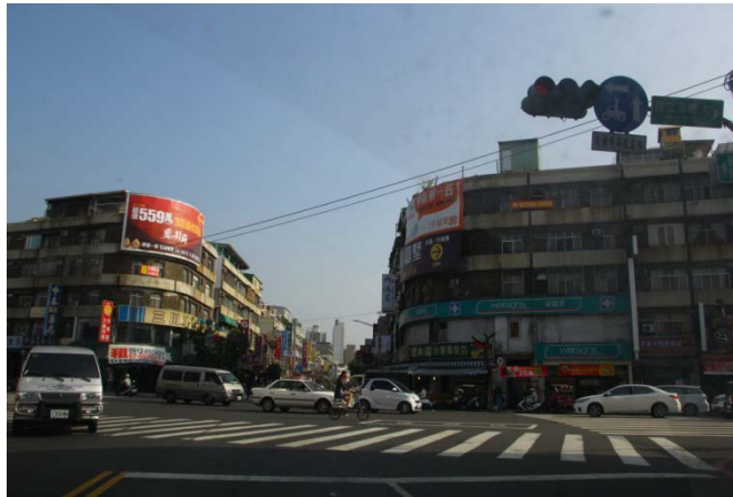
大昌路方向右轉建工