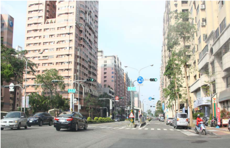
三民區北行往燕巢校區