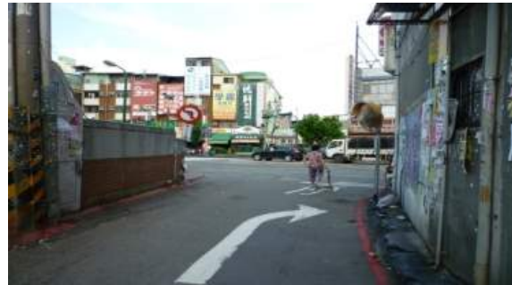
建工路413巷轉出請遵行方向