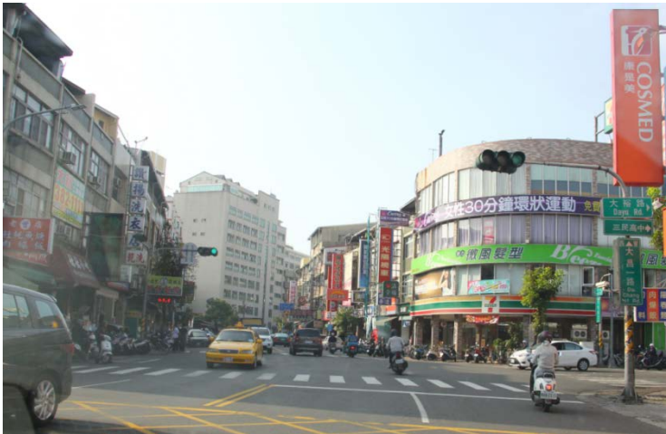
大昌一路右轉大裕路