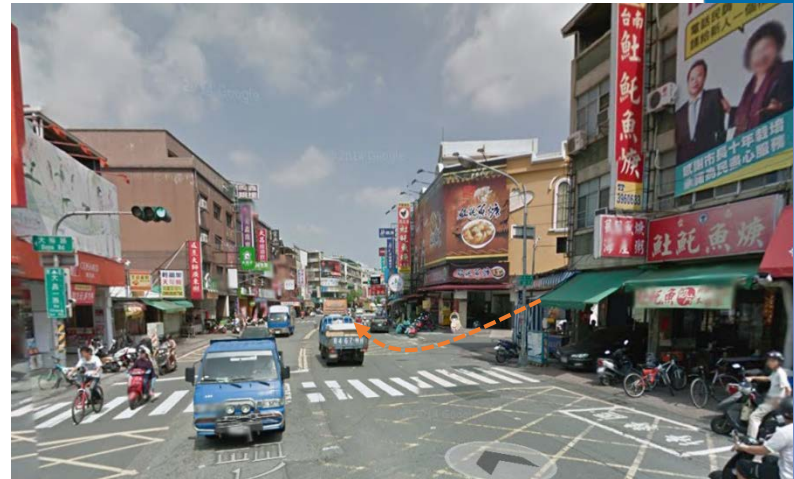
大昌一路往建工路方向