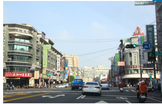
建工路東行往學校